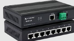
协议转换器 Modbus, Profibus, CAN etc.